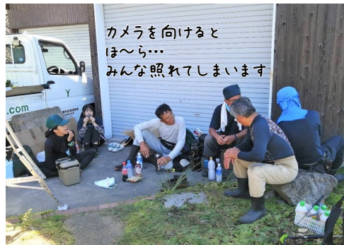
カメラを向けるとほ〜ら…みんな照れてしまいます