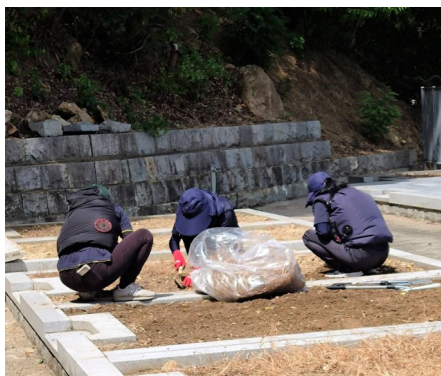
作業の合間にホッと一息。猛暑日にも、みんなが現場で汗を流しました。暑さ対策のための空調作業着を着用して、小まめに休息と給水を取りながらの作業でした。

お墓参りに訪れた方々が喜んで下さって、本当に良かったです。 お盆には、できるだけ整備が進んだ久米山墓地にして参拝者の方をお迎えしたいとの思いで取り組んで来ました。みんな協力して頑張った甲斐がありました。 猛暑が続いた8月。警戒アラートが発令された日にもかかわらず、久米山墓地には黙々と草取りをする社員の姿がありました。お盆まであと数日ということもあり、男女を問わず。配送センターの社員のほとんどが現場へ出向いて汗を流していた日の様子です。